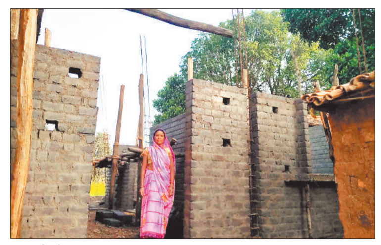
निर्माणधीन पीएम आवास।

प्रदेश में नई सरकार का गठन होने के साथ ही घोषणापत्र के प्रमुख बिंदुओं में से एक पीएम आवास को लेकर सरकार जनता की उम्मीद बढ़ गई है। जिले में भी सत्ता परिवर्तन के बाद पीएम आवास निर्माण कार्य में तेजी आने की उम्मीद जताई जा रही है। इस बीच जिले की बात की जाए तो वर्तमान स्थिति में यहां अभी भी 16 हजार 882 मकानों के निर्माण का कार्य शेष है। हालांकि इन मकानों के निर्माण का कार्य निरंतर जारी है। बता दें कि ग्रामीण क्षेत्र में लोगों को उनका अपना पक्के का मकान देने के लिए प्रधानमंत्री आवास योजना की शुरुआत की गई थी। पीएम आवास योजना में केंद्र व राज्य से मिलने वाली राशि से मकान का निर्माण कराया जाता है। सरगुजा जिले की बात की जाए तो यहां अब तक वर्ष 2016-2023 के मध्य कुल 65905 पीएम आवास की स्वीकृति दी गई थी। इस बीच दो से तीन वर्षों तक केंद्र व राज्य के अंश के चक्कर में किसी भी जिले में स्वीकृत किए गए पीएम आवास की राशि नहीं आई बल्कि पूर्व में स्वीकृत निर्माण कार्यों की राशि भी रोक दी गई थी जिससे निर्माण कार्य अधर में पड़ चुका है। लंबे समय के इंतजार के बाद राशि जारी हुई जिसके बाद निर्माण कार्य