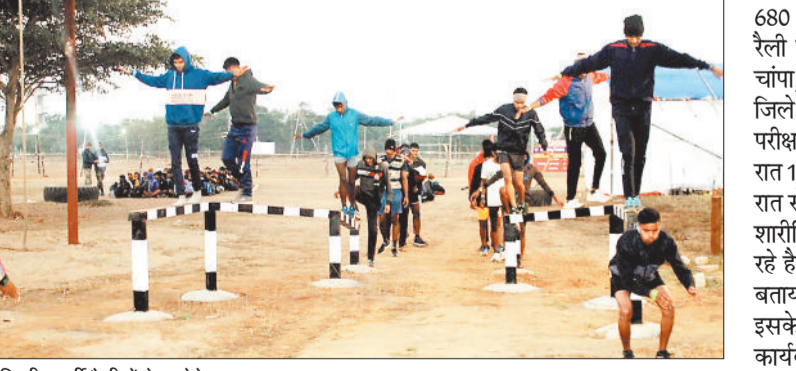
अग्निवीर भर्ती रैली में टेस्ट देते युवा।

अग्निवीर सेना भर्ती रैली की शुरुआत पुलिस लाइन खोखराभांठा जांजगीर में 15 दिसंबर की रात से हो गई है। भर्ती रैली 23 दिसंबर तक चलेगी। इस रैली में सीईई की परीक्षा पास कर चुके 68 सौ अभ्यर्थी शामिल होंगे। भर्ती रैली के दौरान नौजवानों के बीच दौड़, कूद सहित कई तरह के शारीरिक टेस्ट लिए जाएंगे। रैली के पहले दिन सक्ती, बिलासपुर, मनेन्द्रगढ़, चिरमिरी, भरतपुर जिले के युवा शामिल हुए। वहीं दूसरे दिन जांजगीर चांपा के अलावा रायगढ़, मुंगेली, कोरबा और बेमेतरा जिले के युवाओं ने रैली में भाग लिया।